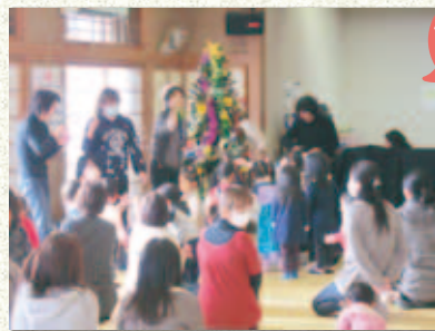
クリスマス会 12月13日