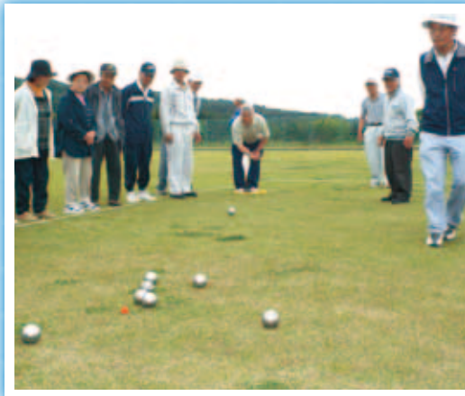
(合計38事業、311回開催、 参加者…延べ9,103名)

●市内高齢者の生きがいと健康づくりのため、スポーツ、文化、三世代交流や生きがい講座等を開催しました。