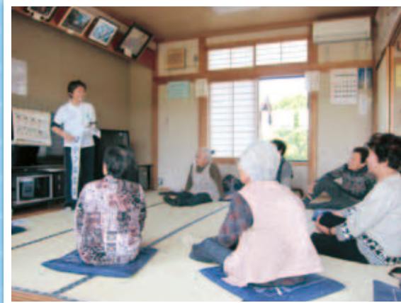
(185回開催、 参加者…延べ2,474名)

●高齢者の介護予防と閉じこもり防止等を目的とする「ふれあい・いきいきサロン」をボランティア等関係機関の協力のもと、市内17地区(中郷・磯原・華川・関南・大津)において開催しました。