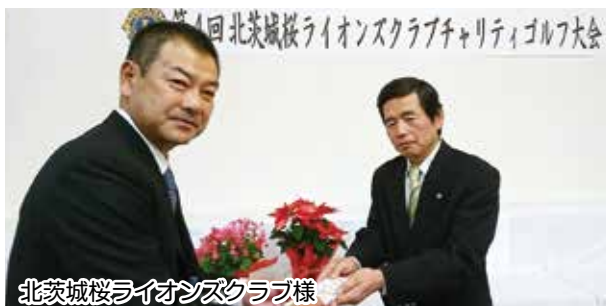
北茨城桜ライオンズクラブ様

北茨城桜ライオンズクラブ様より、地域福祉推進のために役立てて欲しいとご寄付をいただきました。純正化学株式会社茨城工場様からタオル145本が寄贈されました。ご趣旨に沿うように有効に活用させていただきます。ありがとうございました。