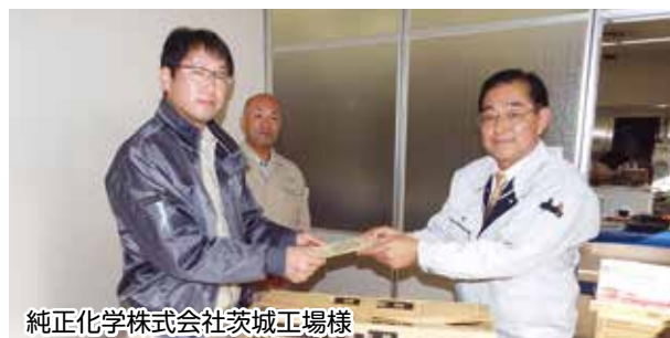
純正化学株式会社茨城工場様