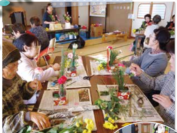
フラワー アレンジメント