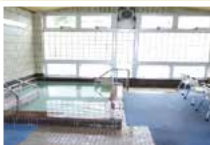
一般浴は開放感があり、温泉気分になります。