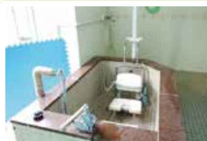
リフト浴は専用のマシンを使い無理なくご入浴できます。