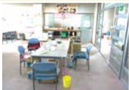
デイ・ルームは広々とした空間でゆっくりお過ごしいただけます。