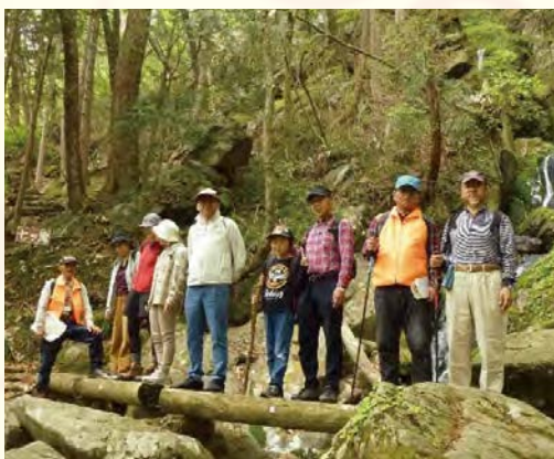
名所七つ滝でぱちり！ (2019撮影)