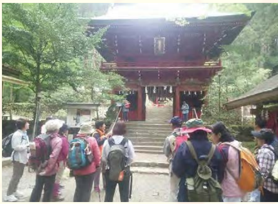
花園ガイドの様子 (2019撮影)

花園地区の観光ガイドをしています。花園神社・花園溪谷・浄蓮寺のガイドや、七つ滝・奥