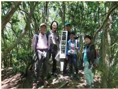
花園山へハイキング (2019撮影)

観光に来られた皆さんが喜んでくれることが一番嬉しいですね。観光にきただけでは分からないところを教えて知ってもらえる、という私たち側の喜びもありますよ。(笑)