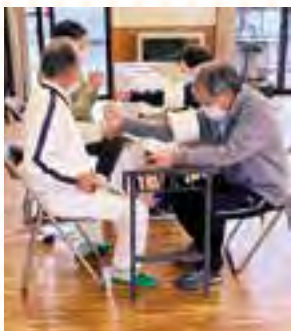
体操前の健康チェック

4月15日(土)、関南多目的集会所にて関南サロンを開催しました。シルバーリハビリ体操指導士会会員の方が体操を行いました。当日は少し肌寒い気候でしたが、体操をするうちに体が温まり元気に活動することができました。