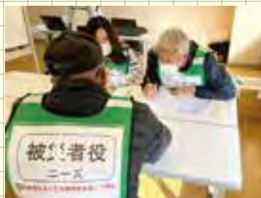
災害ボランティア訓練の様子

茨城県及び茨城県社会福祉協議会では、災害ボランティア活動に必要な様々な情報を発信する特設サイト「災ボラSTANDBY」を開設しました。災害発生時は、県内における「災害ボランティアセンター開設情報」や「災害ボランティア募集情報」などを掲載します。平時には、災害ボランティア活動に関する基礎知識や、災害ボランティア関係の研修、イベント情報をはじめ様々な関連情報を発信していきます。登録後は、毎年度の更新が必要となります。