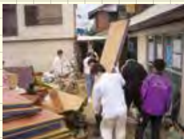
災害ボランティア活動の様子