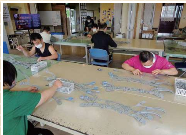
作業訓練のようす(第一)

通所生の皆さんは、市内の会社のご協力により部品付けや資材をまとめる作業を提供していただき、訓練として日々がんばっています。作業