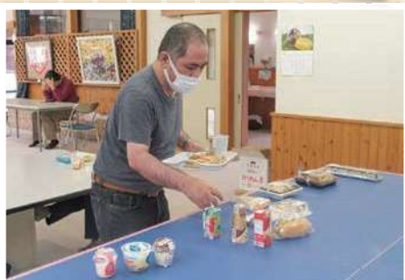
買物学習のようす(第二)