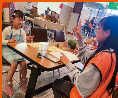
学生ボランティアさんと手話に挑戦