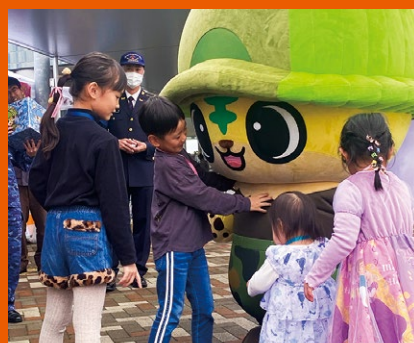
にゃっとらグリーティング