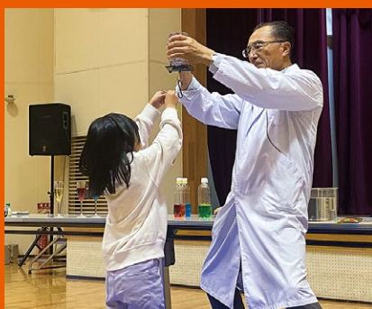
科学マジックショー