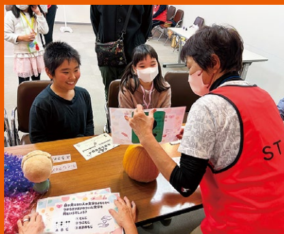
ボランティアさんと福祉クイズ