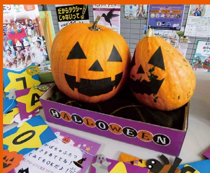
かぼちゃの重さ当て

来年度も充実したイベントを開催できるように努めて参ります。皆さまのご参加を心よりお待ちしております!