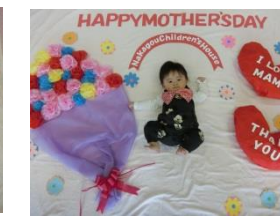
26日(金) 寝相アート「母の日」