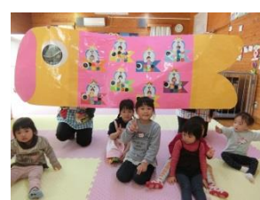
1日(月) 大型こいのぼり製作