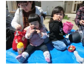
9日(火) みんなでお弁当