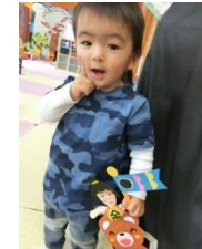
2日(火)・5日(金) こいのぼり製作