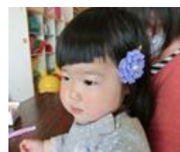
17日(火) 誰でも簡単!ハンドメイド